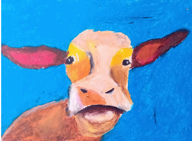
By Leonardo Quaregna (Y8)