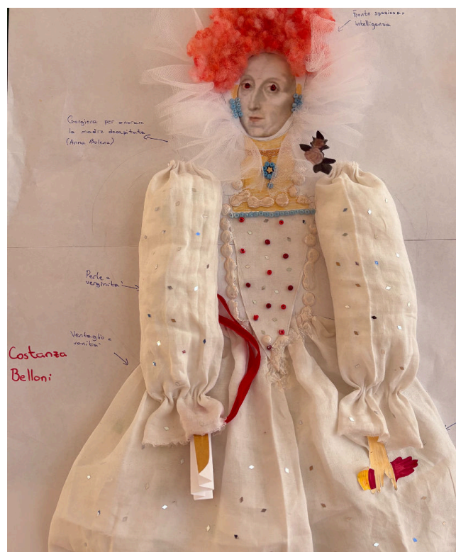
By Costanza Belloni (Y8)

Nel purgatorio invece mi troverei tra gli iracondi nella terza cornice. Perché anche se posso essere gentile a volte, quando qualcuno mi fa arrabbiare diventa una cosa seria. Io gestisco la rabbia in due modi diversi: se mi trovo a scuola sto in silenzio, cercando di tranquillizzarmi da sola; invece, se succede a casa, disegno o vado a fare sport. Ecco perché sono tanto brava in queste discipline. Magari la prossima volta che mio fratello o mio padre mi fanno arrabbiare mi metto a studiare!