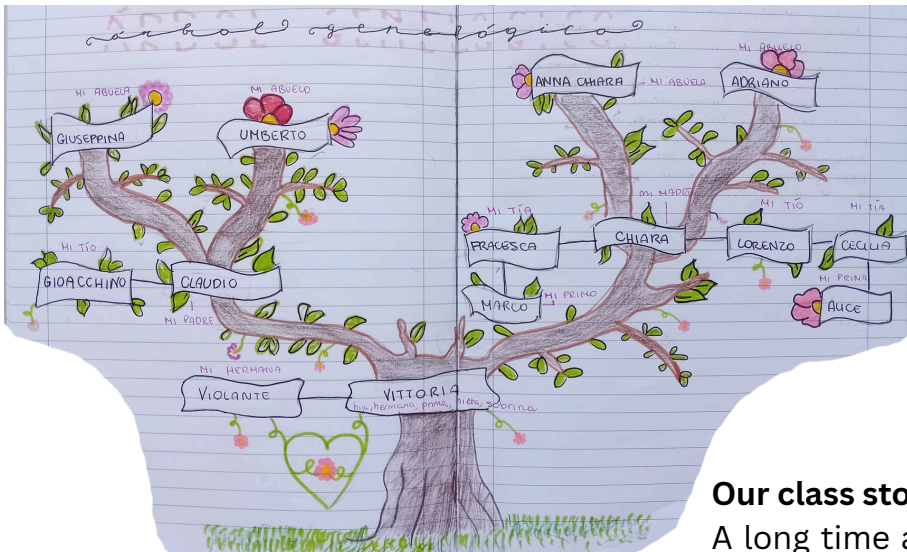
By Vittoria Acampora (Y7)